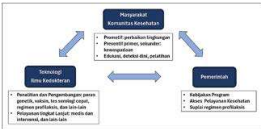
Gambar 3. Strategi penanggulangan Penyakit Jantung Rematik

Penyakit jantung rematik ini adalah penyakit yang dapat dicegah dan dieradikasi. Di Indonesia perlu dilakukan program pengendalian PJR yang mencakup tindakan prevensi, tata laksana lanjut, dan kebijakan kesehatan yang melibatkan komponen masyarakat dan komunitas kesehatan, teknologi dan ilmu kedokteran, serta pemerintah (gambar 3). 71,72